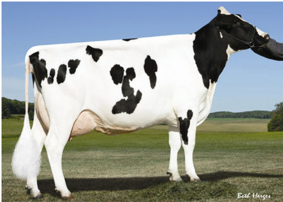
PINE-TREE MONICA PLANETA FOURTH DAM