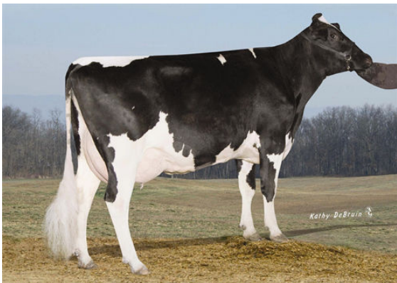
PINE-TREE MONICA SUELA FIFTH DAM