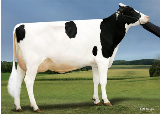
SANDY-VALLEY MD PLEASURE GRANDDAM